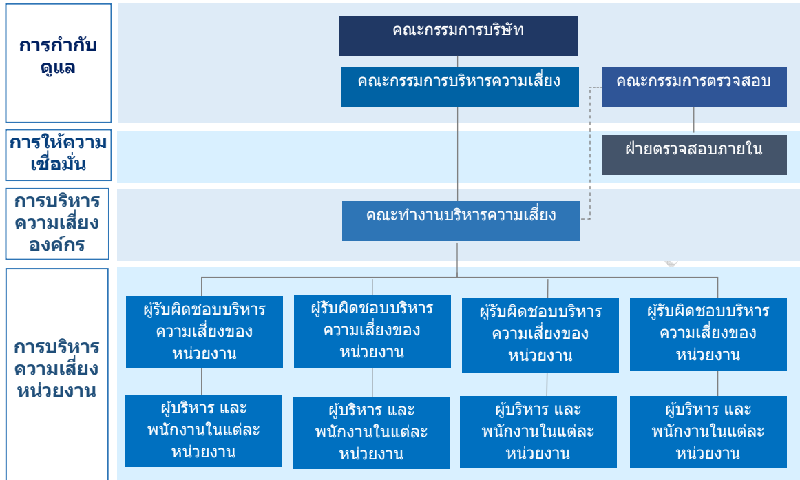
รูป (1) - โครงสร้างการบริหารความเสี่ยงองค์กร